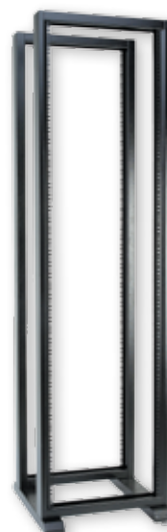
RS-42, RS-42, RS-P